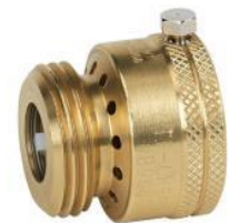
バキュームブレーカー